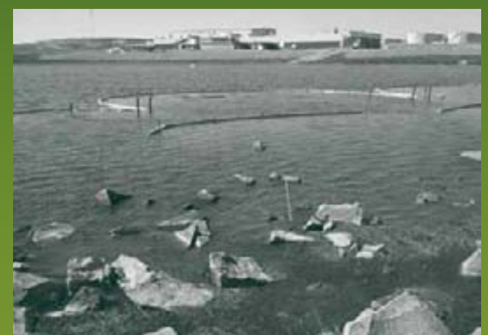
Agency nıréł'ıs hıłchı