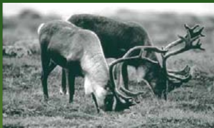
BHP Billiton Canada Inc Nıréł'ıs hıłchı