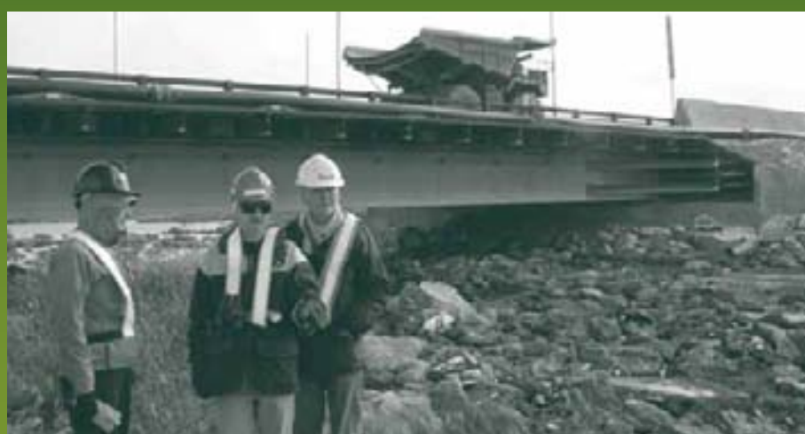
Agency nıréł'ıs hıłchı