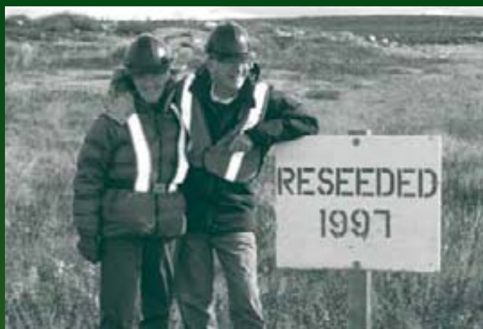
Agency nıréł'ıs hıłchı